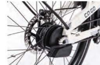
Schalten mit der robusten Enviolo in Automatik-Version.