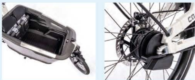
Das Ca Go Bike FS 200 bietet unter anderem eine Transportbox und die automatische Enviolo-Schaltnabe.