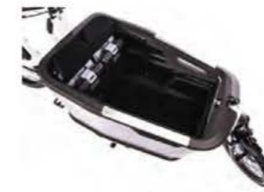
EPP-Box mit anklappbaren Sitzen, top Wendekreis.