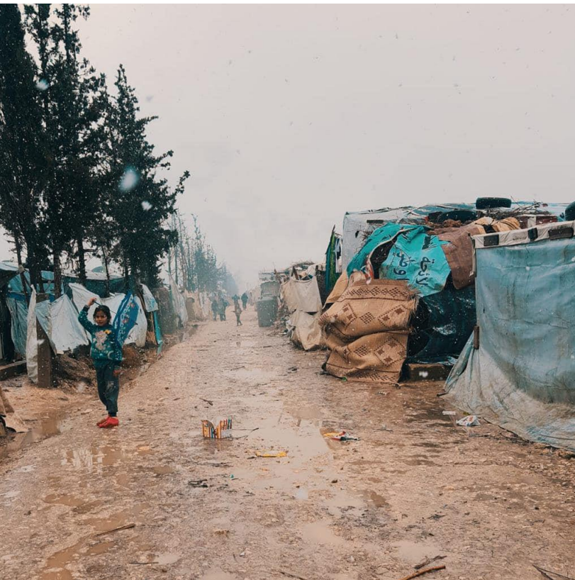
BU: Die Zeltwände bieten nur wenig Schutz gegen Kälte und Wasser