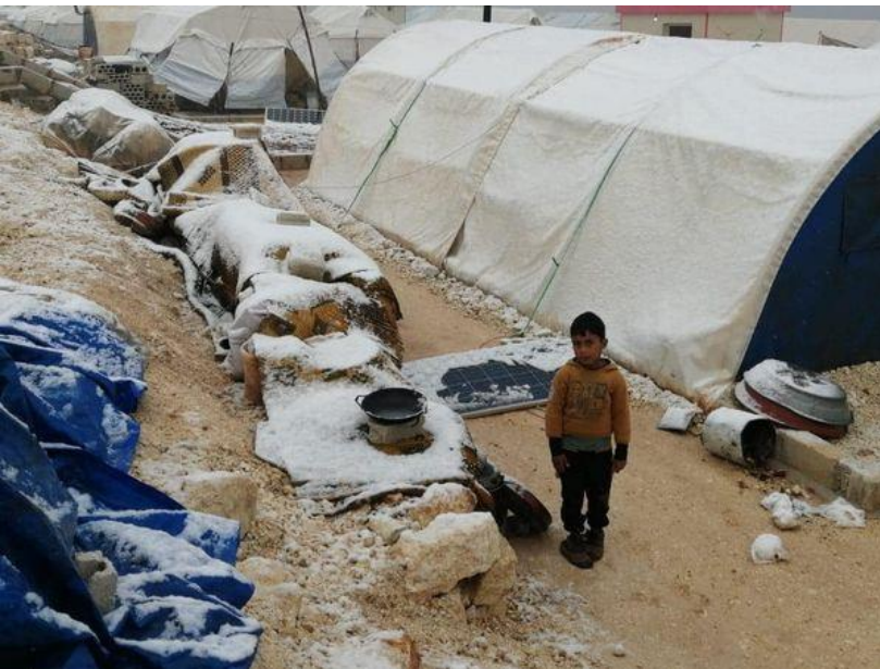
BU: Dieser Junge sammelt Schnee als Trinkwasser in einem Topf