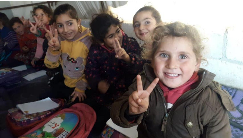
BU: Die Zeltschule gibt den Kindern und ihren Eltern eine Perspektive.